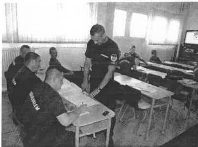
Kressz oktatás vezetéstechnikai oktatónk segítségével 16. számú kép

Az országos, és megyei szervezésű szakmai és sportversenyeken folyamatosan részt veszünk, ahol változó eredménnyel, de biztos helytállással vagyunk jelen. A tavalyi évben rendezett szakmai versenyen a beosztotti kategóriában első helyezést értünk el, míg a megyei lépcsőfutó versenyen csapatban a megye 2. legjobb eredményét, a 30 év feletti kategóriában, pedig a 2., és 3. helyezéseket értük el.