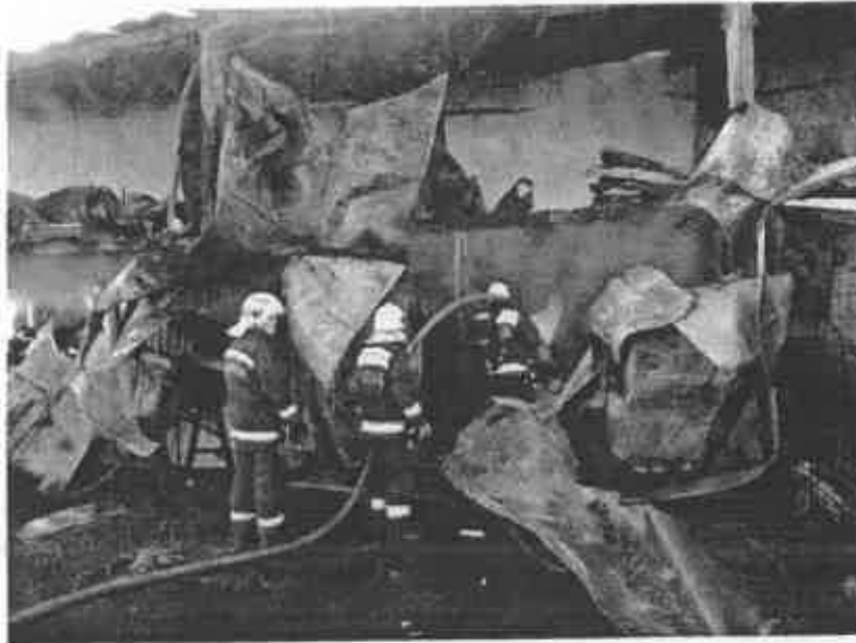
A mátyusi hűtőház-tűz 6. számú kép