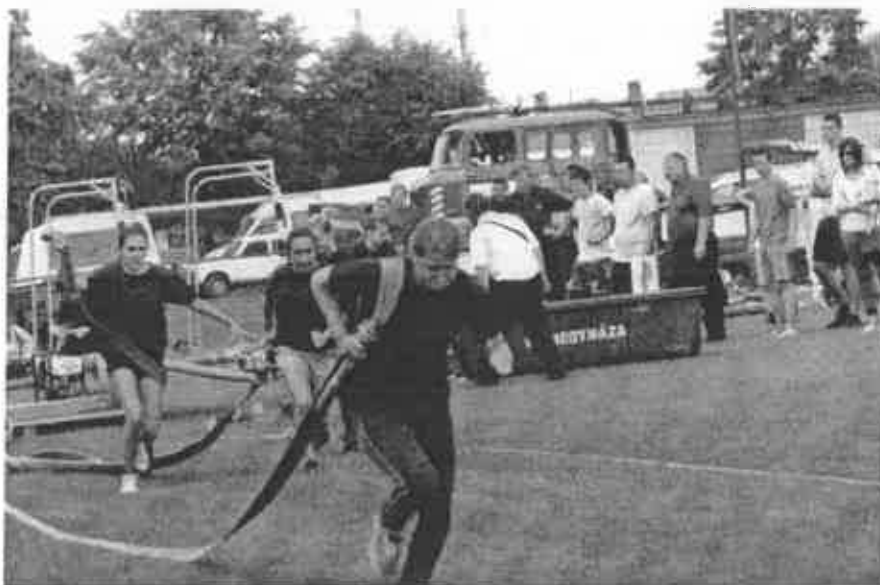
Önkéntes és létesítményi verseny 15. számú kép

A tavalyi évben május 30-án megyei házigazdaként szervezhattük a megyei önkormányzati, önkéntes, és létesítményi tűzoltóversenyt, mely szép időben, nagyszámú versenyző részvételével került megtartásra a Mátészalkai Sportpályán. Külön köszönjük a város önkormányzatának, és polgármester úrnak a szervezéshez, lebonyolításhoz nyújtott segítségét.