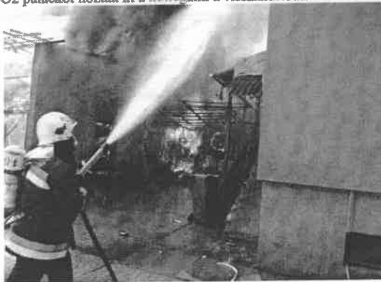
Mátészalka, Tavasz utcai tüzeset 8. számú kép

A szabadterén keletkezett tüzesetek esetén is feladatunk a tűz keletkezési körülményeinek helyszíni vizsgálata. Ezen helyszínek esetében vizsgáljuk, hogy a belterületen, égetés során keletkezett tüzeseteknél a település rendelkezik-e a növényi hulladékok égetésére vonatkozó szabályzóval, illetve az égetés annak megfelelően történt-e.