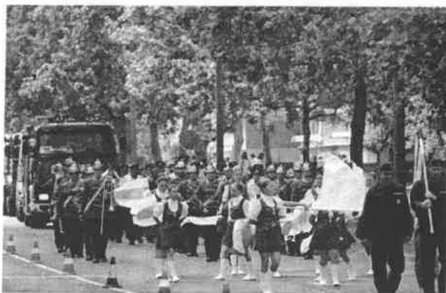
A 125. évfordulós ünnepségünk 13. számú kép

Május 29-én ünnepeltük -megyei szintű rendezvény keretében- a tűzoltóságunk 125. évfordulóját, mely tartalmas és örömteli pillanatokot szerzett a meghívott vendégek és a város polgárainak is.